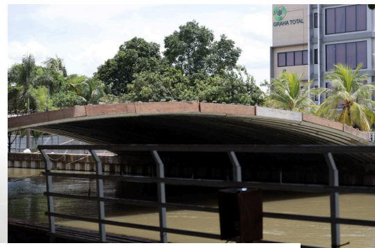
Pengelolaan Destinasi Pariwisata Kawasan Kalimalang