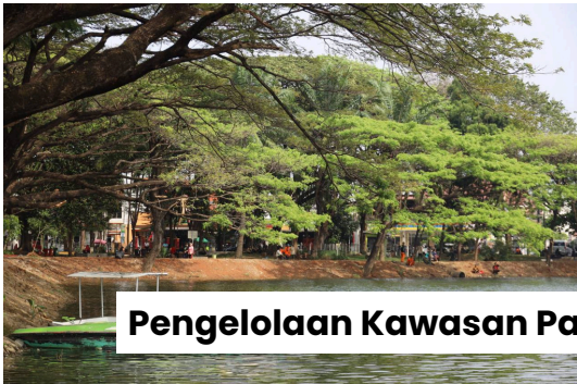
Pengelolaan Kawasan Pariwisata Danau Duta Harapan

Kota Bekasi, dengan kepadatan penduduk yang tinggi dan pesatnya pembangunan, memiliki kebutuhan akan ruang terbuka hijau serta destinasi rekreasi yang memadai bagi warganya. PT. Mitra Patriot (Perseroda) akan mengembangkan area yang memiliki potensi besar untuk dikembangkan menjadi destinasi wisata air yang menarik, menawarkan kesegaran alam dan beragam aktivitas rekreasi serta memadukan keindahan alam danau dengan fasilitas modern yang mendukung kenyamanan dan pengalaman pengunjung, sehingga menjadi ikon wisata baru di Kota Bekasi, meningkatkan kualitas hidup masyarakat, serta menciptakan lapangan kerja dan sumber pendapatan asli daerah.